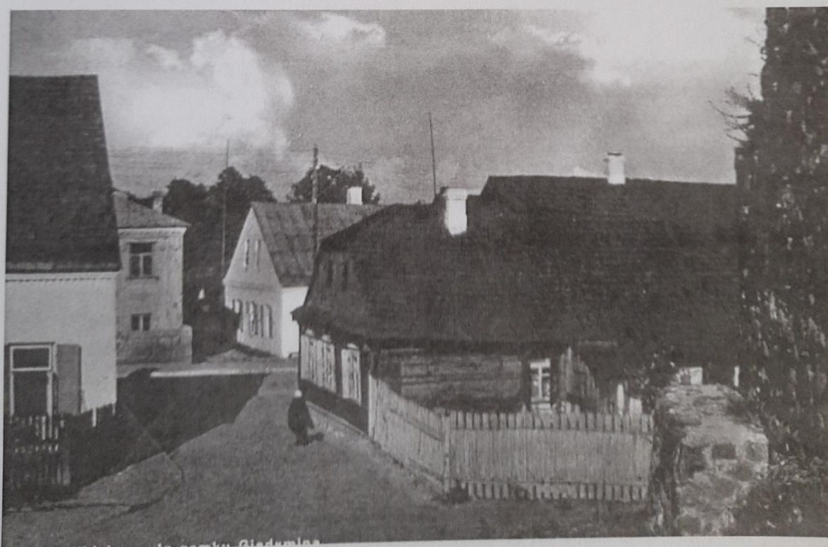
Від з замка на вулицу Замкавую, канец 1920-гг.