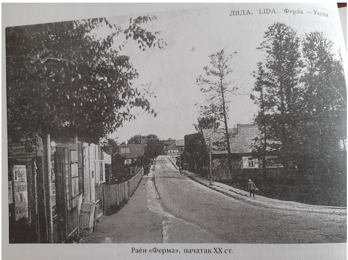
Раён «Ферма», пачатак XX ст.