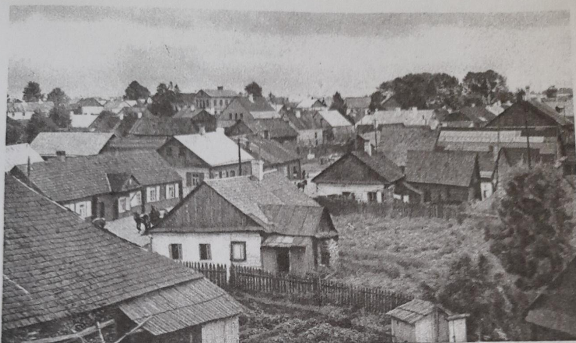
LIDA. Widok z ruin Zamku