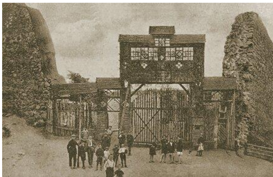
Фатаздымак Лідскага замка