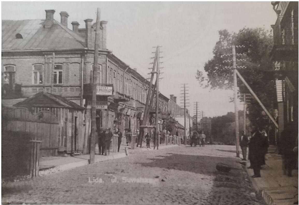
Вуліца Сувальская, злева плот гарадскога парка і пачатак вуліцы 3-га Мая, 1920-я гг.