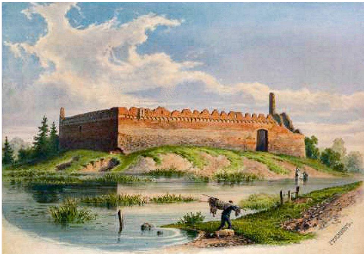
Лідскі замак на каруіне Васілія Грязнова. Втарая палавіна XIX ст.