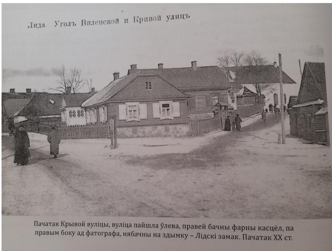
Пачатак Крывой вуліцы, вуліца пайшла ўлева, правей бачны фарны касцёл, па правым боку ад фатографа, нябачны на здымку – Лідскі замак. Пачатак XX ст.