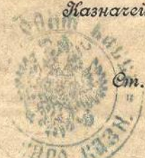
Эта квитанция так же на выплату ссуды Виленскому отделению Крестьянского поземельного банка.